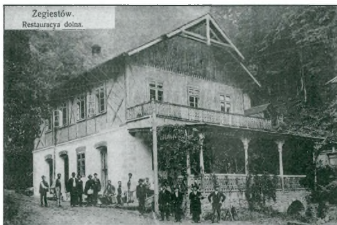
Pocztówka ca 1910 r. Nad drugimi drzwiami od lewej pod lupą widoczny napis „Apteka”. Lokalizacji tej nie wspominają cytowane w artykule źródła

Obecnie Żegiestów Zdrój przeżywa okres głębokiego upadku. Piękne i zadbane niegdyś sanatoria oraz domy wypoczynkowe stoją puste, czekając na lepsze czasy. Zlikwidowana została także apteka i nic nie wskazuje, aby w najbliższym czasie ktoś zechciał ponownie ubiegać się o jej otwarcie.