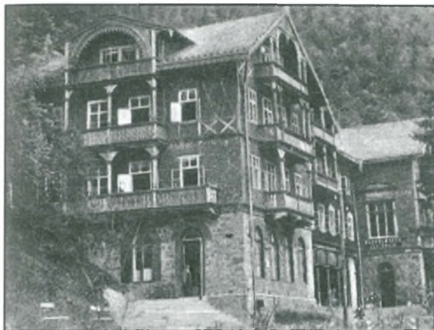
Dom Zdrojowy. Pierwsza siedziba żegiestowskiej apteki.