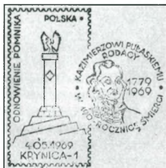
Stempel okolicznościowy – 1969 r.