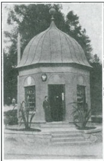
„Kiosk” w Krynicy