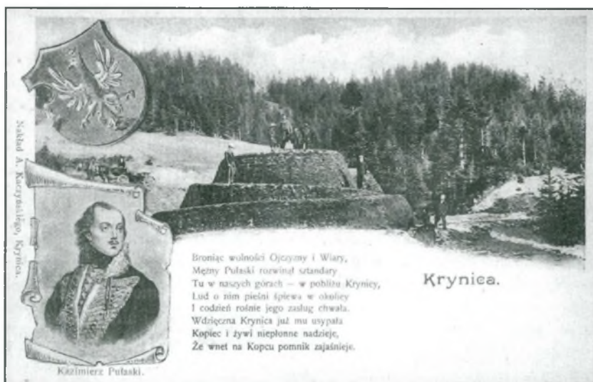
Pocztówka ca 1905 r.

Kopiec jest jednym z nielicznych na terenie dawnego „państwa muszyńskiego” zabytkowych ziemnych obiektów kubaturowych, ukształtowanych ręką człowieka dla dobra ogólnego. Zaliczam do nich okopy konfederatów barskich w Muszynie i Izbach, pozostałości wałów otaczających Muszynę od strony południowej i kopiec Pułaskiego. Mamy tak niewiele śladów przeszłości – chrońmy je.