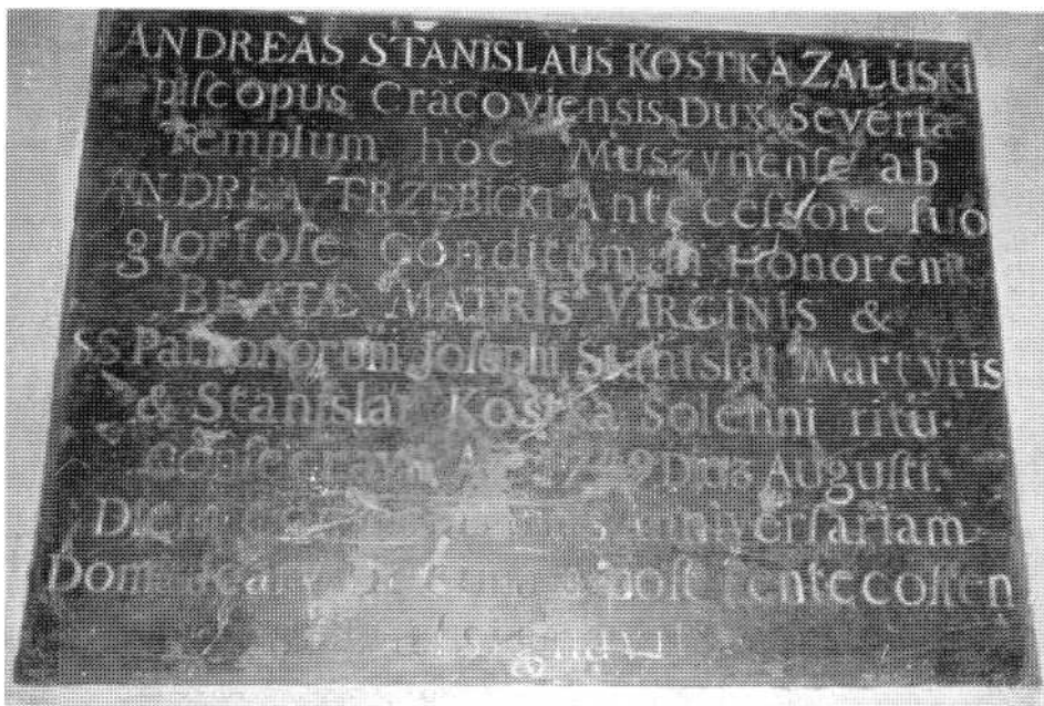
Tablica poświęcona biskupowi A. Załuskiemu.

Litery na tej tablicy są bardzo zróżnicowane. Imiona i nazwiska biskupów Załuskiego (w wierszu pierwszym), Trzebickiego (w wierszu czwartym) oraz imię Najświętszej Marii Panny (w wierszu szóstym) podkreślono drukowanymi literami. Pozostałe słowa wyryto kursywą, przy czym litery mają po 3 cm wysokości. Dodatkowo zróżnicowano wysokość liter w wierszu pierwszym. Litera „A” w imieniu biskupa Trzebickiego ma 4 cm wysokości, pozostałe litery jego imienia mają po 3 cm, litera „S” w słowie Stanisław ma 3,5 cm, pozostałe — po 3 cm. Z kolei litera „K” w słowie Kostka ma również 3,5 cm (pozostałe po 3 cm), zaś litera „Z” w słowie Załuski ma 3,7 cm wysokości (pozostałe po 3 cm). W wierszu czwartym w imieniu biskupa Trzebickiego pierwsza litera ma 3,5 cm, pozostałe po 3 cm. Litery nazwiska Trzebicki jeszcze silniej zróżnicowano — litera „T” ma 3,2 cm, litera „R” 2,9 cm, pozostałe litery nazwiska po 3 cm. Wreszcie w wierszu szóstym słowo „Beatae” również zróżnicowano — litera „B” ma 3,2 cm, pozostałe po 2,7 cm. Z kolei słowa „Matris” i „Virginis” mają aż po 3,5 cm wysokości. W wierszu szóstym i ósmym słowo „et” zastąpiono symbolem &.