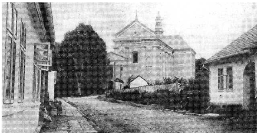
Kościół w Muszynie — pocztówka z 1904 roku.