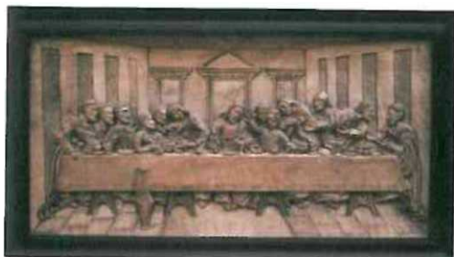
Włodzimierz Obszarski „Ostatnia wieczerza” (rzeźba w drewnie)