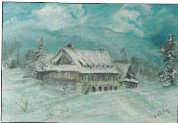
Barbara Cichy „Zimowy pejzaż” (olej na