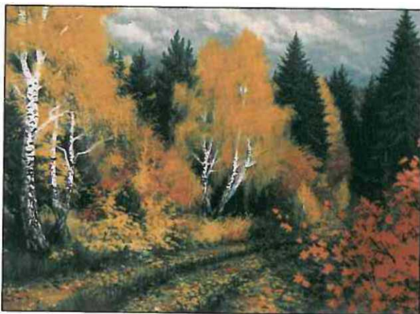
Krzysztof Mitrega „Jesienny pejzaż” (olej na