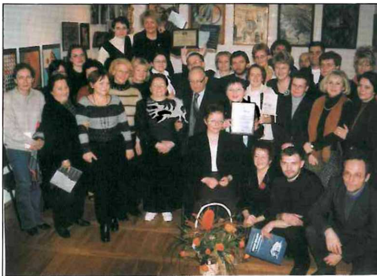
Artyści i przyjaciele Galerii „Pod Kasztanem” podczas uroczystości jubileuszowej

Wszystkim przedsięwzięciom Klubu Twórczego w roku jubileuszowym oraz poprzedzającym towarzyszyła kamera, a efektem tego jest film, który przybliży poczynania krynickiego środowiska twórczego skupionego w Galerii „Pod Kasztanem". Bardzo starannie prowadzone Kroniki (6) zawierają historię Oddziału, wpisy i autografy, informacje prasowe, a także bogatą dokumentację fotograficzną, obrazującą wydarzenia artystyczne i literackie. Są ważną, a zarazem piękną pamiątką wspólnego przeżywania twórczych prezentacji.