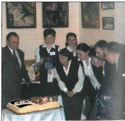
Tort w kształcie księgi przygotowali uczniowie Zespołu Szkół Ponadgimnazjalnych w Krynicy