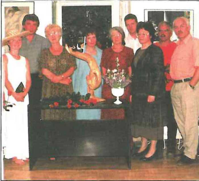
Spotkanie poetów Sądeckizny w Galerii „Pod Kasztanem”, Krynica 2001

nieprzyjaznych kulturze - 15 lat to duże osiągnięcie, zwłaszcza gdy weźmie się pod uwagę, jak ważne są podejmowane przez Klub Twórczy działania, w które społecznie zaangażowane jest środowisko artystyczne skupione w Galerii oraz sympatycy i wolontariusze. Galeria „Pod Kasztanem” znana jest daleko poza granicami Sądeckizny, a przyczyniły się do tego między m.in. wydawnictwa promujące twórczość malarzy, rzeźbiarzy i poetów. W spotkaniach ze sztuką i poezją uczestniczą mieszkańcy Krynicy, a także